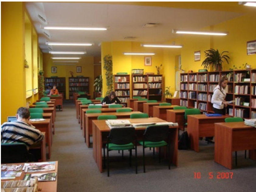
Czytelnia Książek

Po przewiezieniu zbiorów byłej Biblioteki ANS do magazynów nowo powstałej Biblioteki Humanistycznej, Biblioteka Główna pod koniec 2006 r. opuściła użytkowany budynek byłego Studium Wojskowego.