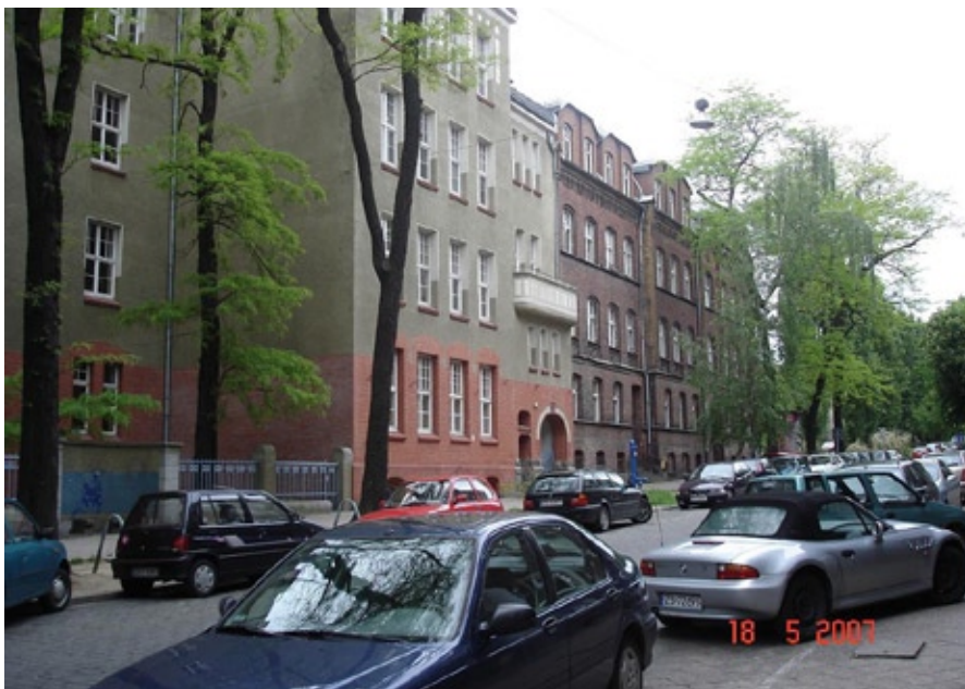
Biblioteka Główna. Oba budynki od ul. Tarczyńskiego

W „nowej części” przy ul. Tarczyńskiego znalazła swoje miejsce Czytelnia Książek, Czytelnia Czasopism, Ośrodek Informacji Naukowej z Czytelnią Multimedialną, Czytelnia Zbiorów Specjalnych, Centrum Informacji i Dokumentacji Europejskiej. Na trzecim piętrze zaplanowane zostały magazyny książek.