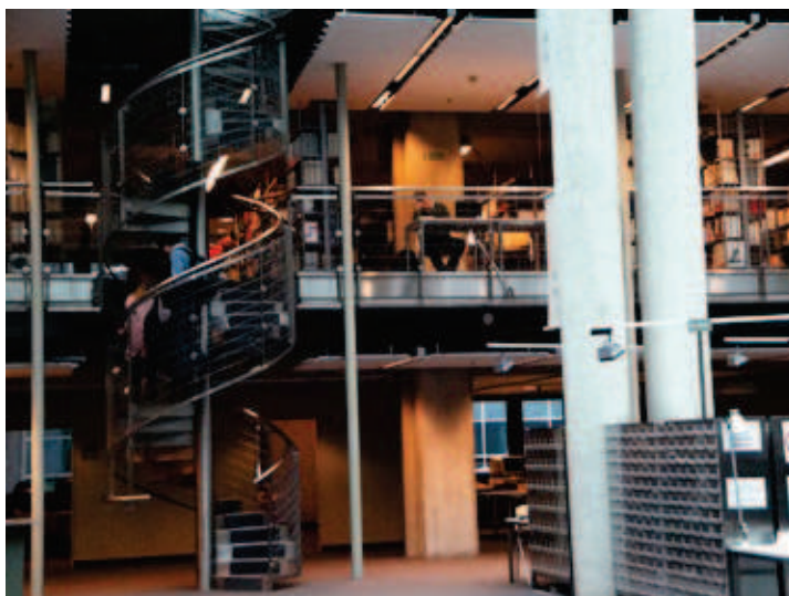
Wejście na poziom 2 - detale architektoniczne