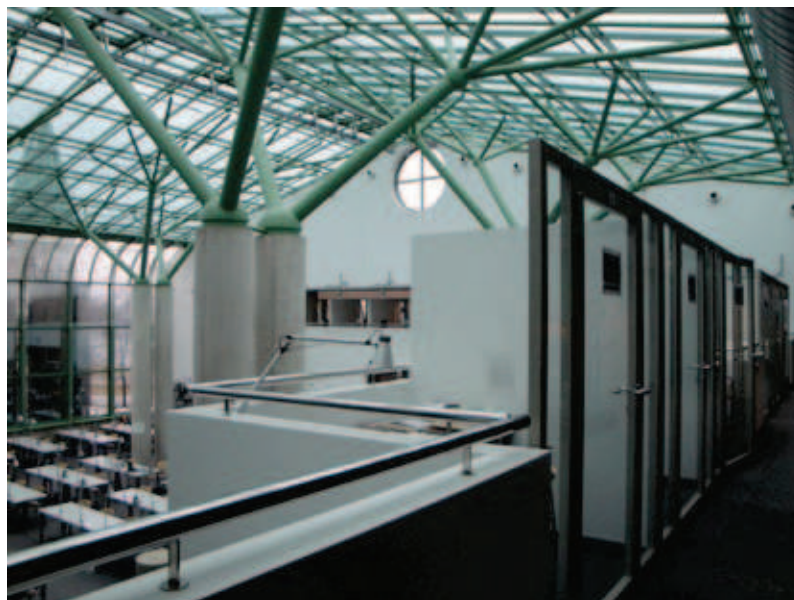
Kabiny pracy indywidualnej nad Czytelnią Ogólną

współkatalogowania, źródło gotowych opisów katalogowych, to także centralna informacja o zasobach naukowych i akademickich bibliotek w Polsce.