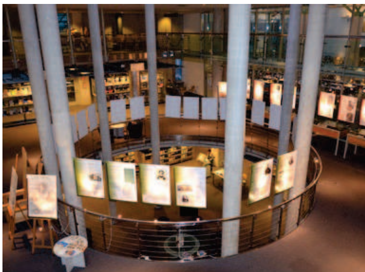
Wystawa "Chemicy - absolwenci Uniwersytetu Warszawskiego" przed Czytelnią Ogólną

BUW nie tylko gromadzi i udostępnia książki. Organizowane są tu konferencje, spotkania, wystawy, liczne imprezy o charakterze kulturalnym. Ale Biblioteka Uniwersytecka w Warszawie to przede wszystkim księżnica naukowa. Ciągłe poszerzany jest dostęp do licencjonowanych zasobów elektronicznych. Baza e-czasopism licząca obecnie ponad 114 tys. tytułów e-czasopism jest prawdopodobnie największa w Polsce. Powiększana jest również kolekcja e-książek – w styczniu 2012 r. BUW zakupił dostęp do 70 tys. książek na platformie ebrary.