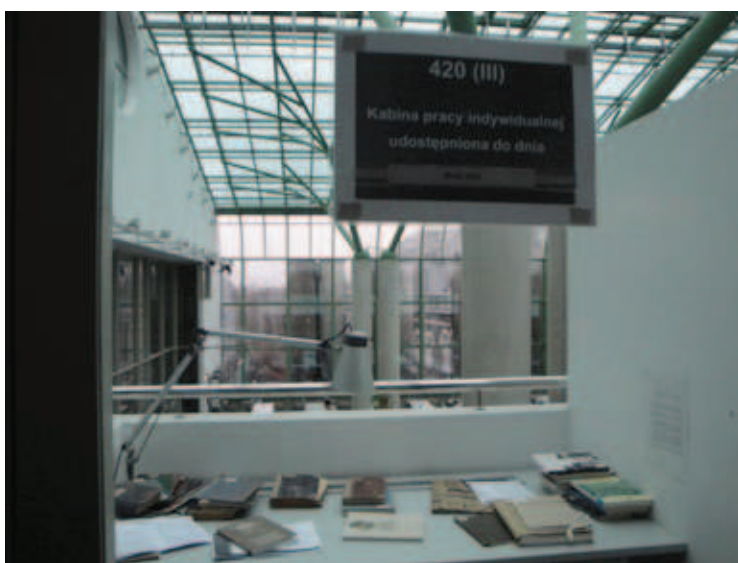
Jedna z kabin pracy indywidualnej nad Czytelnią Ogólną

Ta atrakcyjna forma e-learningu wykorzystywana jest zarówno do prowadzenia szkoleń, jak również popularyzacji zbiorów oraz organizowanych w Bibliotece wydarzeń kulturalnych, wystaw. Tematyka webinarium to m. in.: „Zbiory XIX w. w BUW”, „Problematyka dokumentów życia społecznego w bibliotece akademickiej”, „30. rocznica wprowadzenia stanu wojennego – dokumenty w zbiorach BUW i wspomnienia pracowników”, „Chemicy – absolwenci Uniwersytetu Warszawskiego” – webinarium towarzyszące wystawie pod tym samym tytułem przygotowanej przez pracowników BUW.