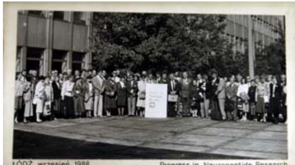
ŁÓDŹ, wrzesień 1988