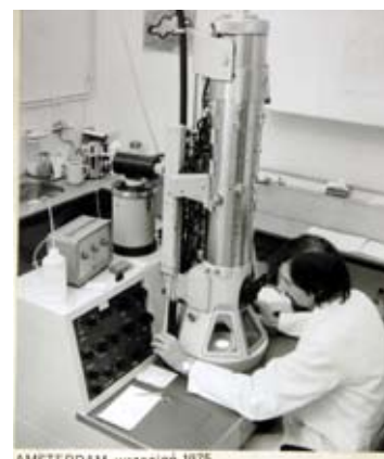
AMSTERDAM, wrzesień 1975