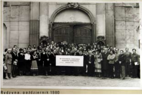
Rydzyzna, październik 1980