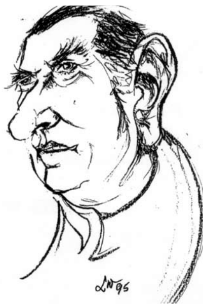
Łatwiej zeszepecić innych niż siebie (autokarykatura z 1995)