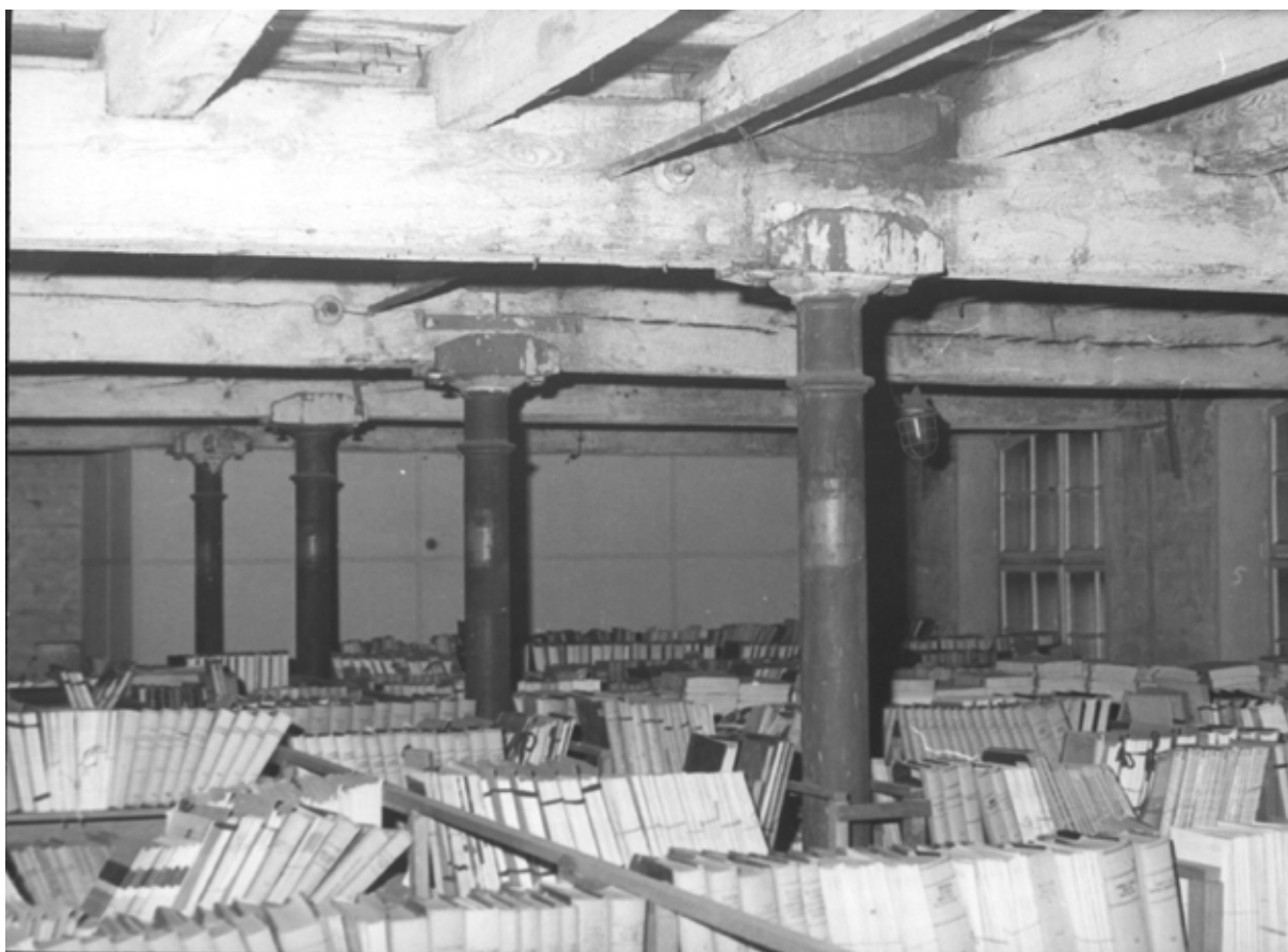
Magazyn zbiorów bibliotecznych przy al. Kościuszki 10. Widok na pękający strop

Organizująca się uczelnia borykała się z ogromnymi trudnościami lokalowymi. Z konieczności przyjęto na pomieszczenia biblioteczne, na okres przejściowy, halę pofabryczną o powierzchni ok. 300 m 2 , mieszczącą się na pierwszym piętrze budynku przy al. Kościuszki 10. Ze względu na konieczność szybkiego udostępnienia zbiorów, wykonano tylko niezbędne prace remontowe i adaptacyjne. W marcu 1951 roku Biblioteka przyjęła pierwszych czytelników. Zaznaczyć należy, iż lokal pod każdym względem nie odpowiadał wymogom bibliotecznym, a także warunkom higieny i bezpieczeństwa pracy. Duża sala pofabryczna przegrodzona cienką ścianką, oddzielała magazyn i wypożyczalnię od czytelni i pracowni, a czytelnię od pracowni oddzielały szafy. Do magazynu, wypożyczalni, czytelni i pracowni prowadziło jedno wejście przez czytelnię, co nawet przy niezbyt ożywionym ruchu wprowadzało hałas i zamieszanie. Pomieszczenia były niedogrzone w zimie, a magazyn całkowicie pozbawiony źródła ciepła. Brak dostatecznej liczby podręczników i zakaz wypożyczania czasopism, wymuszały pobyt w czytelni, natomiast oferowane warunki do korzystania na miejscu były isticie spartańskie.