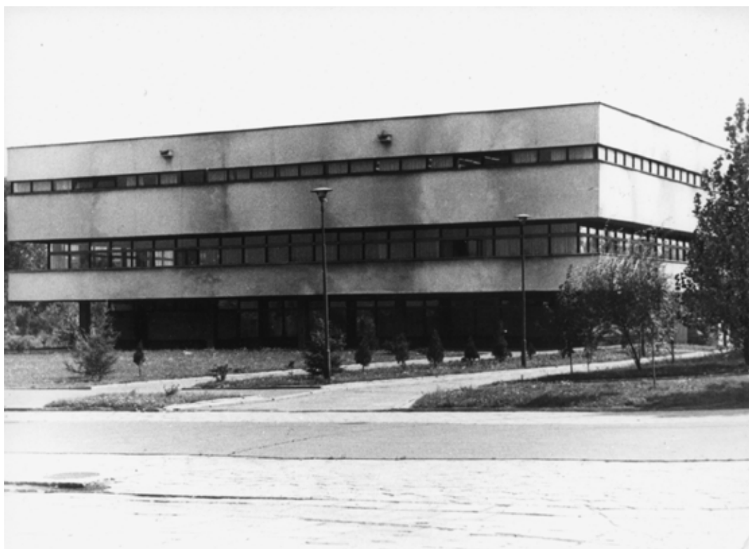
Budynek Biblioteki Głównej. Spojrzenie od ul. Muszyńskiego

Już w początkach istnienia wydziałów lekarskich w ramach Uniwersytetu wśród ich pracowników zrodziła się idea stworzenia własnej, specjalistycznej biblioteki. Tak powstała Biblioteka Wydziału Lekarskiego UŁ, mieszcząca się w sali wykładowej przy ul. Narutowicza 65. Na decyzję wyodrębnienia tej biblioteki ze zbiorów BUŁ miały znaczny wpływ dotacje finansowe Ministerstwa Zdrowia na zakup książek i czasopism. Dzięki nim oraz darom pochodzącym z różnych źródeł już w roku 1948 zebrano księgozbiór liczący około 5360 vol. Warunki pracy biblioteki wydziałowej zarówno lokalowe jak i kadrowe były skromne. W pomieszczeniu bibliotecznym odbywały się posiedzenia rad wydziałowych, podczas których bibliotekarze musieli przerywać pracę i opuszczać salę. Ograniczone też było korzystanie ze zbiorów.