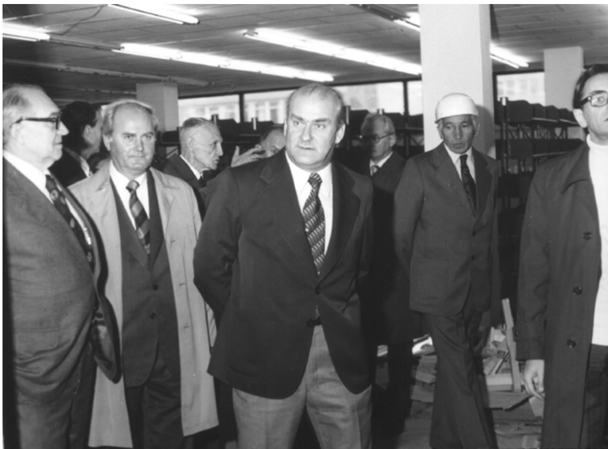
Zwiedzanie budynku. Na pierwszym planie Minister Zdrowia prof. dr hab. Marian Śliwiński