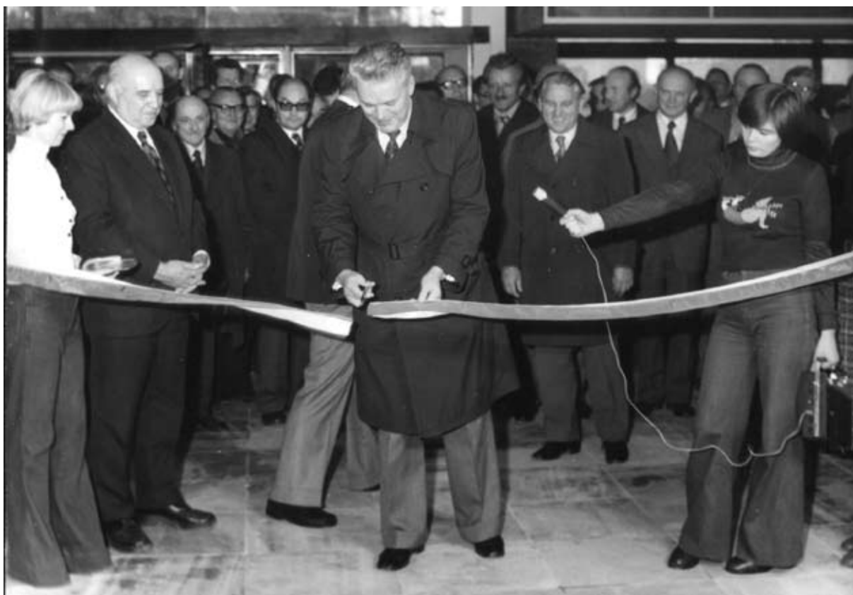
Uroczyste przecięcie wstęgi oddawanego do użytku gmachu Biblioteki (5 X 1977)