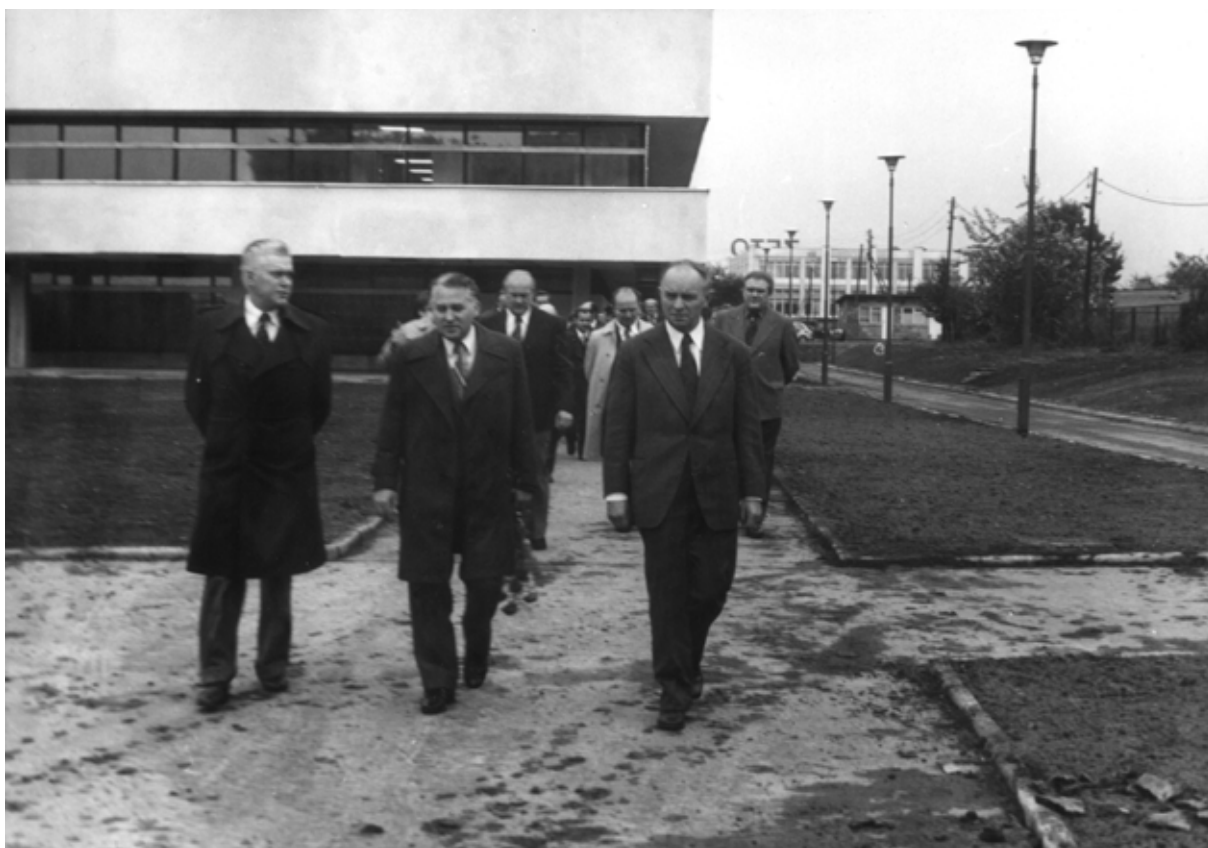
Koniec uroczystości. Goście opuszczają teren