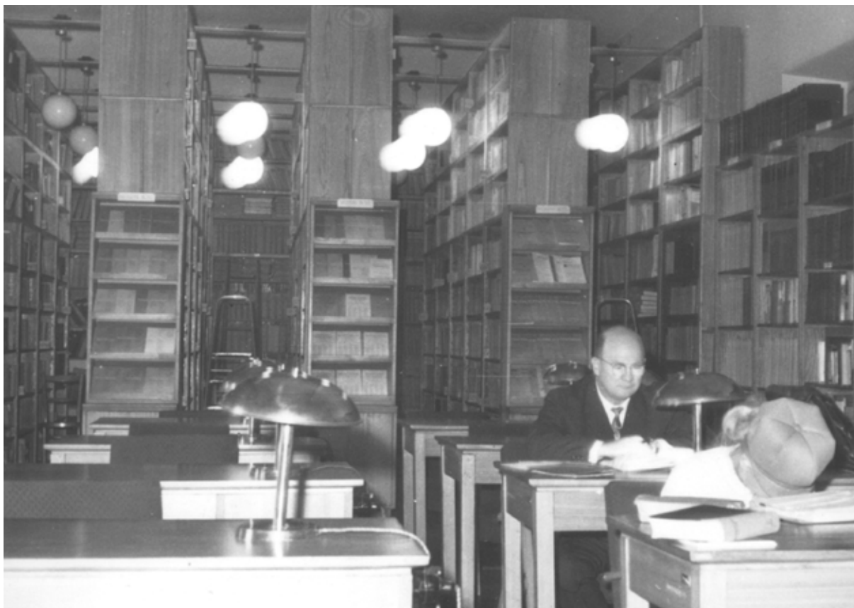
Czytelnia naukowa przy al. Kościuszki 4