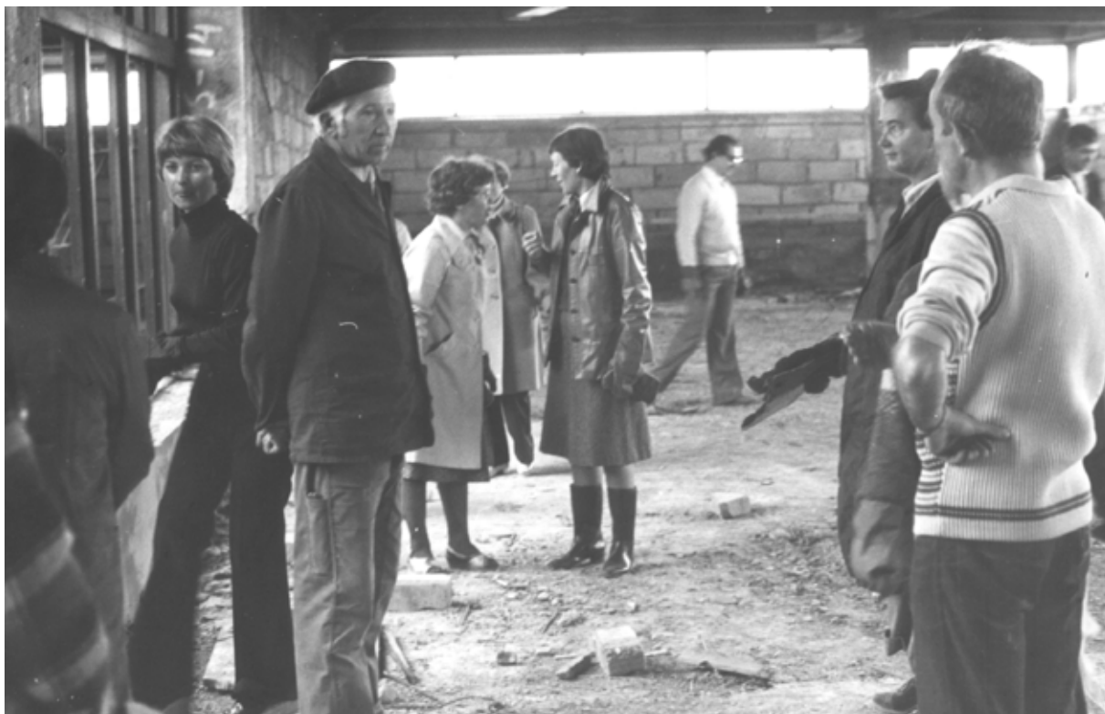
Porządkowanie placu budowy Biblioteki przez bibliotekarzy w tzw. „czynnie społecznym” (1976) - chwila relaksu