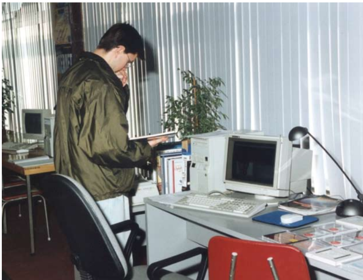
Oddział Informacji Naukowej. Stanowisko komputerowe dla użytkowników

Od 2002 roku działa sieciowy dostęp do czasopism w wersji elektronicznej w ramach prenumeraty rocznej oraz przez system Eifl Direct – Ebsco. Nawiązana wcześniej współpraca bibliotek medycznych zaowocowała teraz ścisłą współpracą w sieci, wymianą doświadczeń, wspólnym opracowaniem projektów rozwojowych. Sprzęt komputerowy i oprogramowanie przyniosły rewolucyjne zmiany w Oddziale Informacji Naukowej. Korzyści z nich czerpią zarówno użytkownicy jak i bibliotekarze. Czasochłonne i żmudne ongiś poszukiwania literatury, najczęściej nie zapewniające kompletności, dzisiaj trwa zaledwie kilka minut i taką gwarancję daje. Dla mnie, autorki tych wspomnień jest to osiągnięcie ogromne. Przy opracowywaniu kwerend bibliograficznych spędzałam bowiem długie godziny wertując Current List of Medical Literature, Index Medicus i inne źródła bibliograficzne światowego piśmiennictwa lekarskiego. Korzystanie z nich było bardzo męczące, ze względu na drobną czcionkę druku oraz niekompletność numerów. Po skomputeryzowaniu działalność informacji naukowej nabrała tempa. Dobre warunki lokalowe, odpowiednie wyposażenie w sprzęt oraz księgozbiór podręczny i fachowa obsada sprawiły, iż agenda ta stała się wiodącą w Bibliotece, miejscem gdzie łatwo i szybko zdobyć można profesjonalną informację.