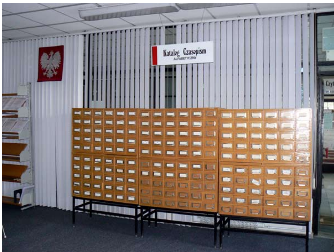
Katalog czasopism w Oddziale Informacji Naukowej

roku książki, czasopisma oraz zbiory specjalne katalogowane są na bieżąco, jak i retrospektywnie w komputerowym systemie bibliotecznym Horizon .