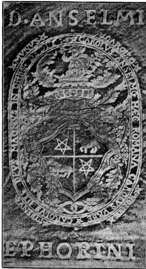
Herb Anzelma Ephorinusa. Reprodukcja wykonana przez dr. Kazimierza Plekarskiego.

cyrkiel, w II lis w prawo i w III zajęć w prawą stronę bieży; i na hełmie pół ukoronowanej osoby widocznej do kolan, w prawej ręce trzyma węża, lewa zaś oparta o biodro.“ Żaden z tych opisów jednak nie odpowiada niestety rzeczywistości.