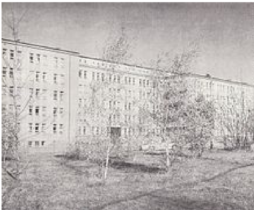
Szpital Św. Kazimierza w Radomiu (dawniej).