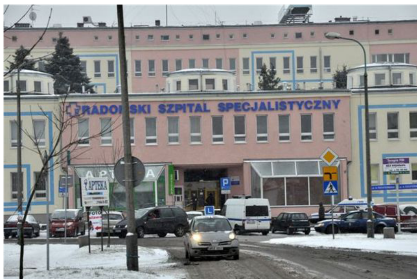
Radomski Szpital Specjalistyczny w Radomiu.