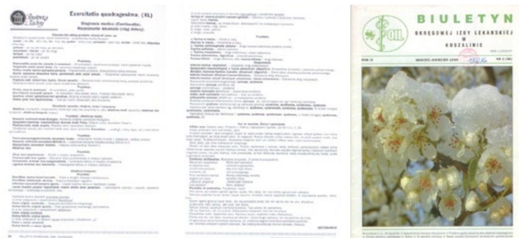
„Powtórka z łaciny” Biuletyn Okręgowej Izby Lekarskiej w Koszalinie

czasie napływały już książki i czasopisma z Głównej Biblioteki Lekarskiej. Efektem utworzenia biblioteki lekarskiej było to, że „instytucja ta stała się dużą pomocą w pracy naukowej. W związku z tym lekarze Szpitala Wojewódzkiego otworzyli przewody doktorskie w Akademiach Medycznych” 11 .