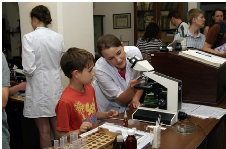
Pokazy podczas Nocy Muzeów w 2013 roku. Zbiory Samodzielnej Pracowni Historii Medycyny i Farmacji UMB