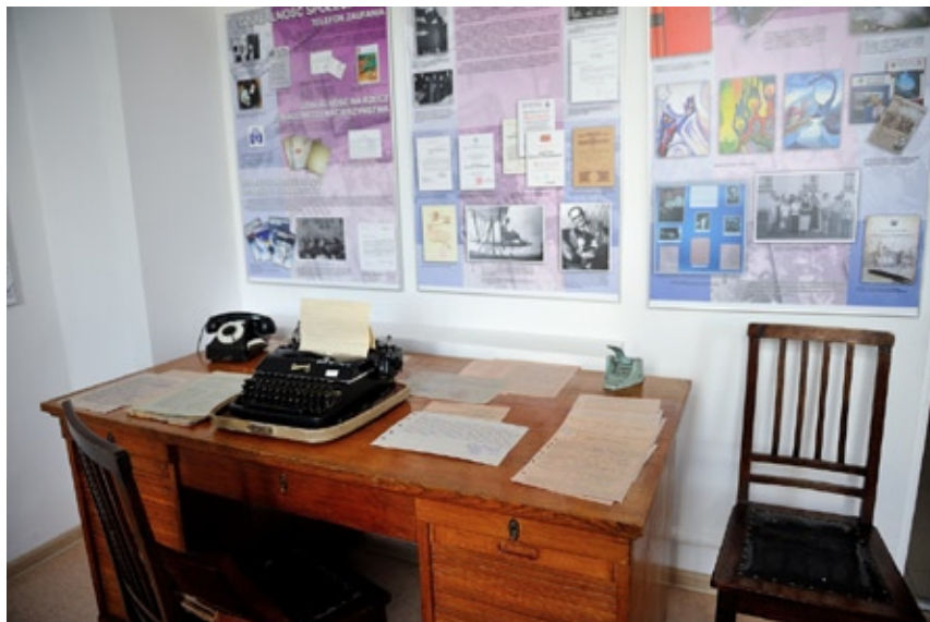
Sala historii UMB.