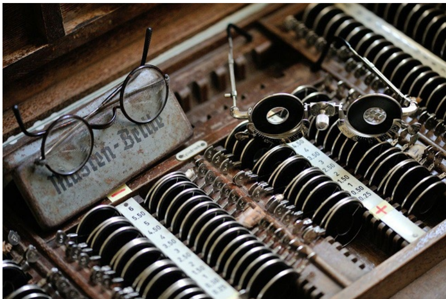
Fragment wyposażenia gabinetu okulistycznego. Zbiory Samodzielnej Pracowni Historii Medycyny i Farmacji UMB