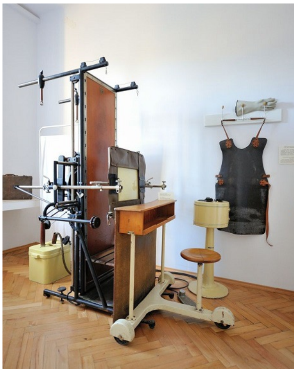
Gabinet rentgenowski.