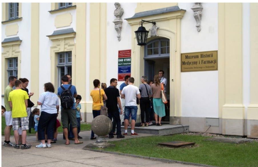
Muzeum Historii Medycyny i Farmacji UMB, Noc Muzeów 2013 r.