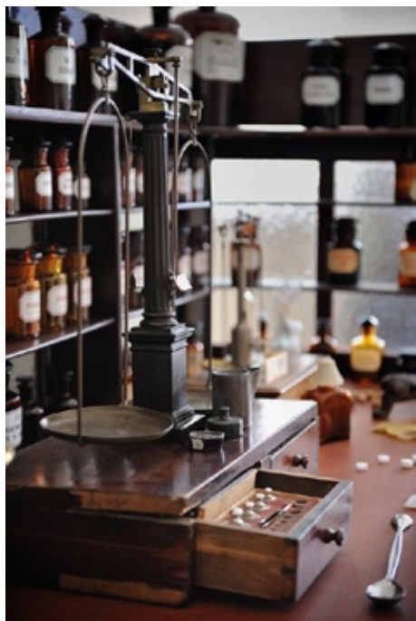
Ekspozycja „Tajemnice dawnej apteki”. Zbiory Samodzielnej Pracowni Historii Medycyny i Farmacji UMB