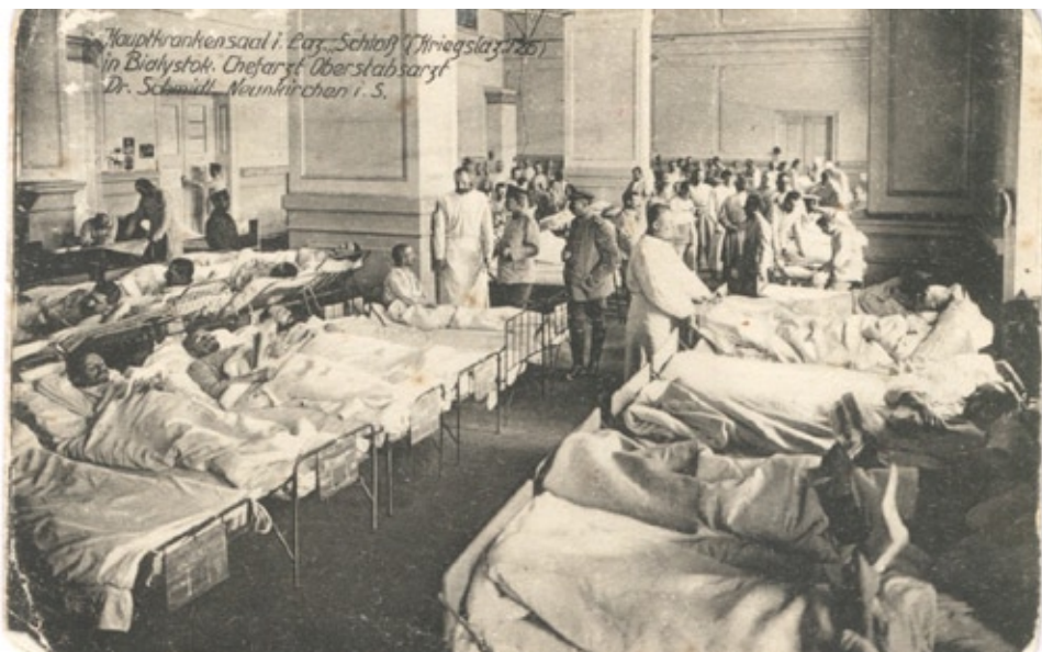
Niemiecki szpital wojskowy w Pałacu Branickich w Białymstoku, 1915 rok.