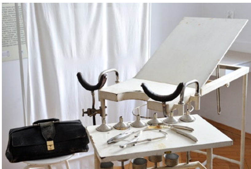
Gabinet ginekologiczny.