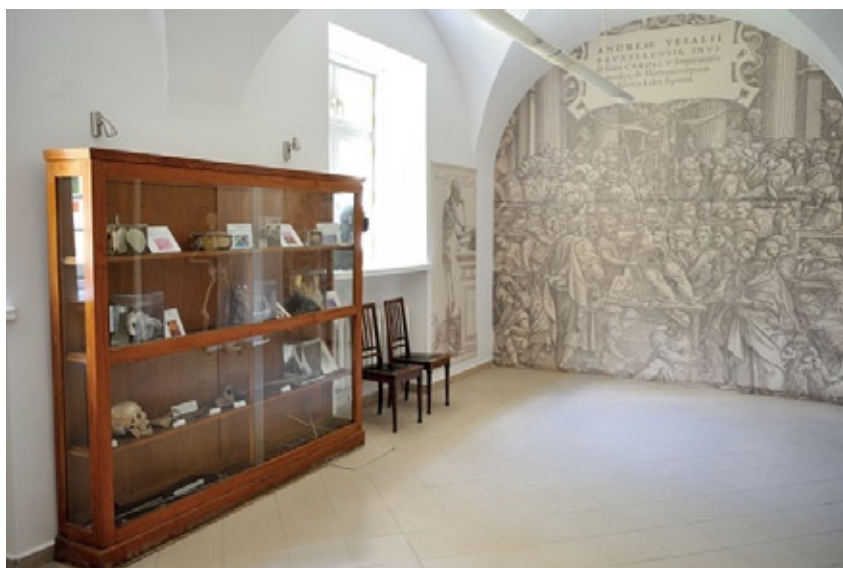
Gabinet anatomico-patologiczny