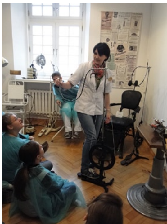
Zajęcia edukacyjne w Muzeum.