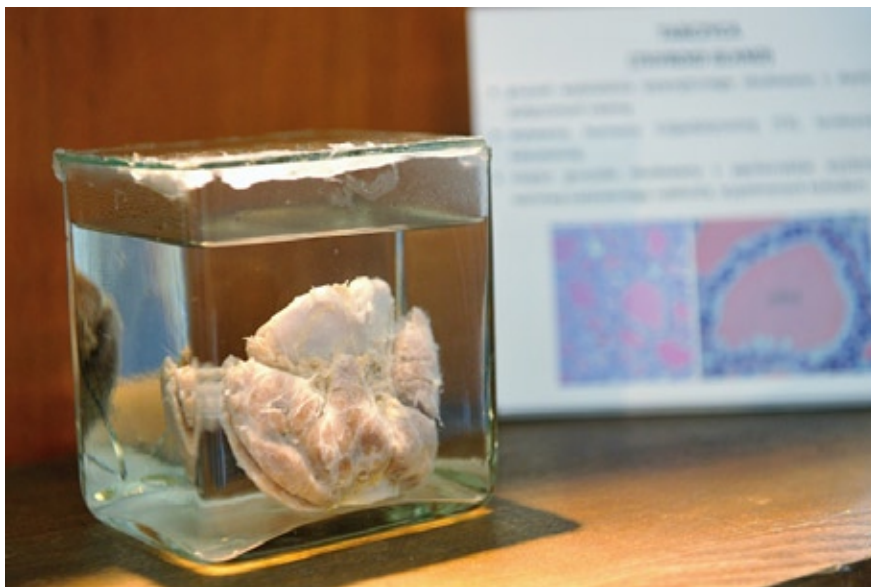
Preparat anatomo-patologiczny. Zbiory Samodzielnej Pracowni Historii Medycyny i Farmacji UMB