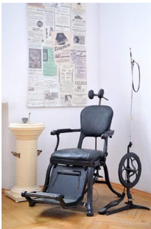
Zbiory stomatologiczne Muzeum. Zbiory Samodzielnej Pracowni Historii Medycyny i Farmacji UMB