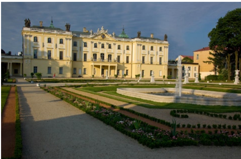
Pałac Branickich w Białymstoku. Stan z 2012 roku.