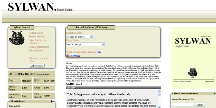
Ryc. 6. Witryna internetowa fałszywego czasopisma Sylwan. English Edition